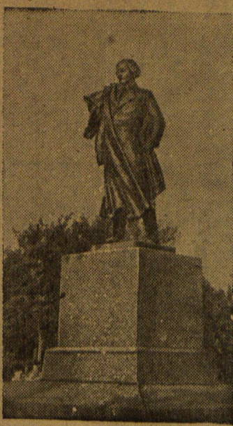
Новый памятник великому русскому писателю Н. В. Гоголю, установленный в Московском Центральном парке культуры и отдыха.